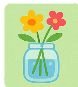
May Primavera in un barattolo Spring in a Jar