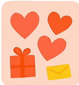
February Arte del cuore Heart Art