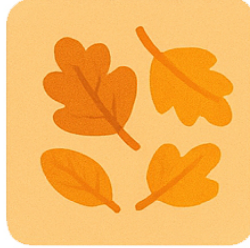
November Fogli d'autunno Autumn Leaves