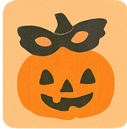
October Zucche di carta e decorazioni Pumpkin Creations