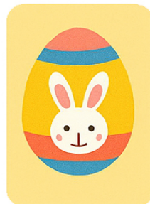
April Caccia All'Uovo Egg Hunt