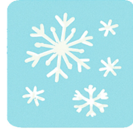
January Snowflakes Creations Creazioni di Fiochi di Neve