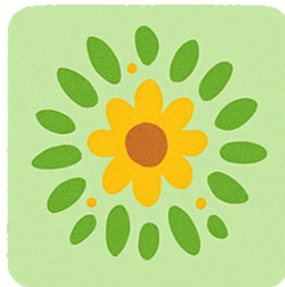
March Mandala naturali Nature Mandalas