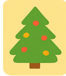
December Magia di Natale Christmas Magic